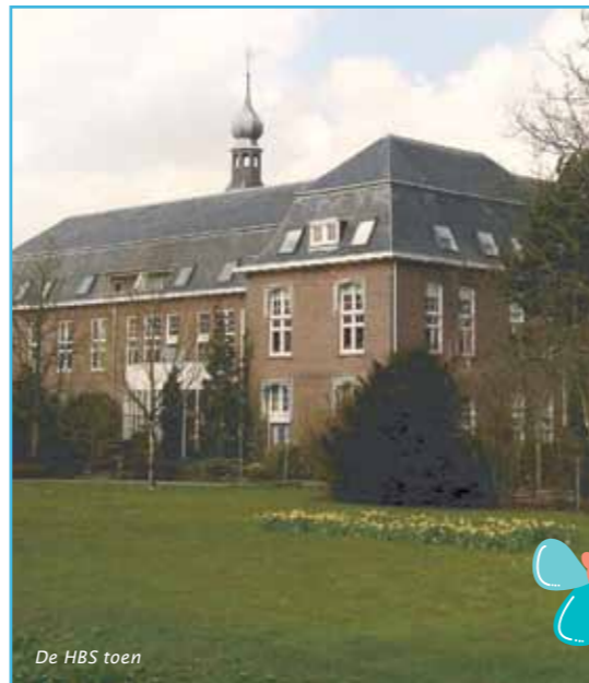
De HBS toen

De laatste mooie ontwikkeling op personeelsgebied is de in-company masteropleiding 'Educational Needs' die onlangs voor Acis-personeel van start is gegaan en waar maar liefst twintig medewerkers aan mee doen. Deze pittige opleiding is vooral gericht op het nóg beter herkennen en leren omgaan met gedragsproblematiek van leerlingen. Over twee jaar hebben we er dus heel wat gedragspecialisten op onze scholen bij. Voor wie niet meedoet aan de mastersopleiding is er bovendien nog het rijke nascholingsaanbod van de Acis Academie. Voor wie dacht dat Acis alleen de beste basis was voor leerlingen had het mis; dat geldt zeker ook voor het personeel.