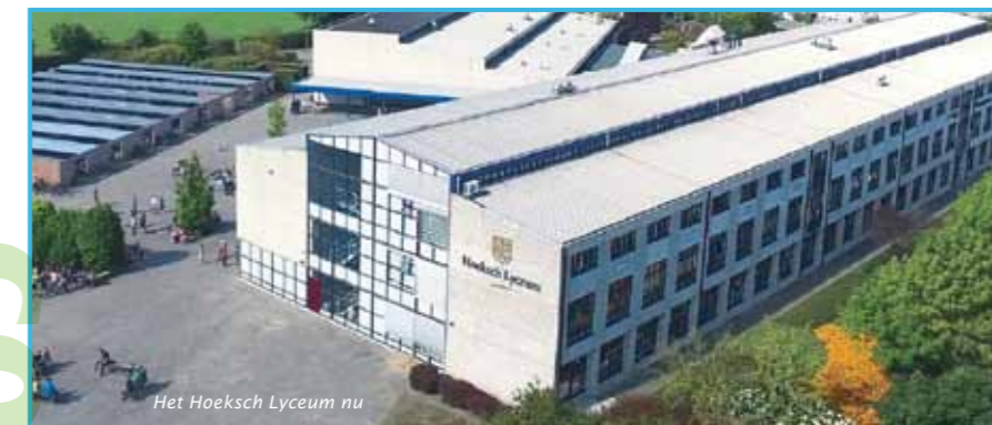
Het Hoeksch Lyceum nu

Het duurt nog even, maar de voorbereidingen zijn gestart voor de viering van het 100-jarig bestaan van het Hoeksch Lyceum in Oud-Beijerland.