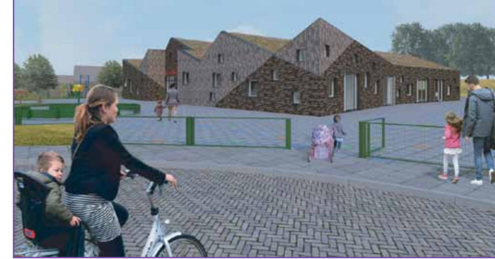
Een impressie van het nieuwe IKC De Pijler

De school aan de Fazant is nu nog verdeeld over het hoofdgebouw en een dependance maar in de toekomst wordt alles samengevoegd in één gebouw. Het nieuwe gebouw krijgt een dorps uitstraling, met een mos-sedum dak. Over de buitenruimte wordt nog nagedacht. De leerlingenraad van De Pijler is al enthousiast plannen aan het maken om geld in te zamelen om het nieuwe schoolplein, dat in ieder geval een natuurlijk karakter zal krijgen, in te richten.